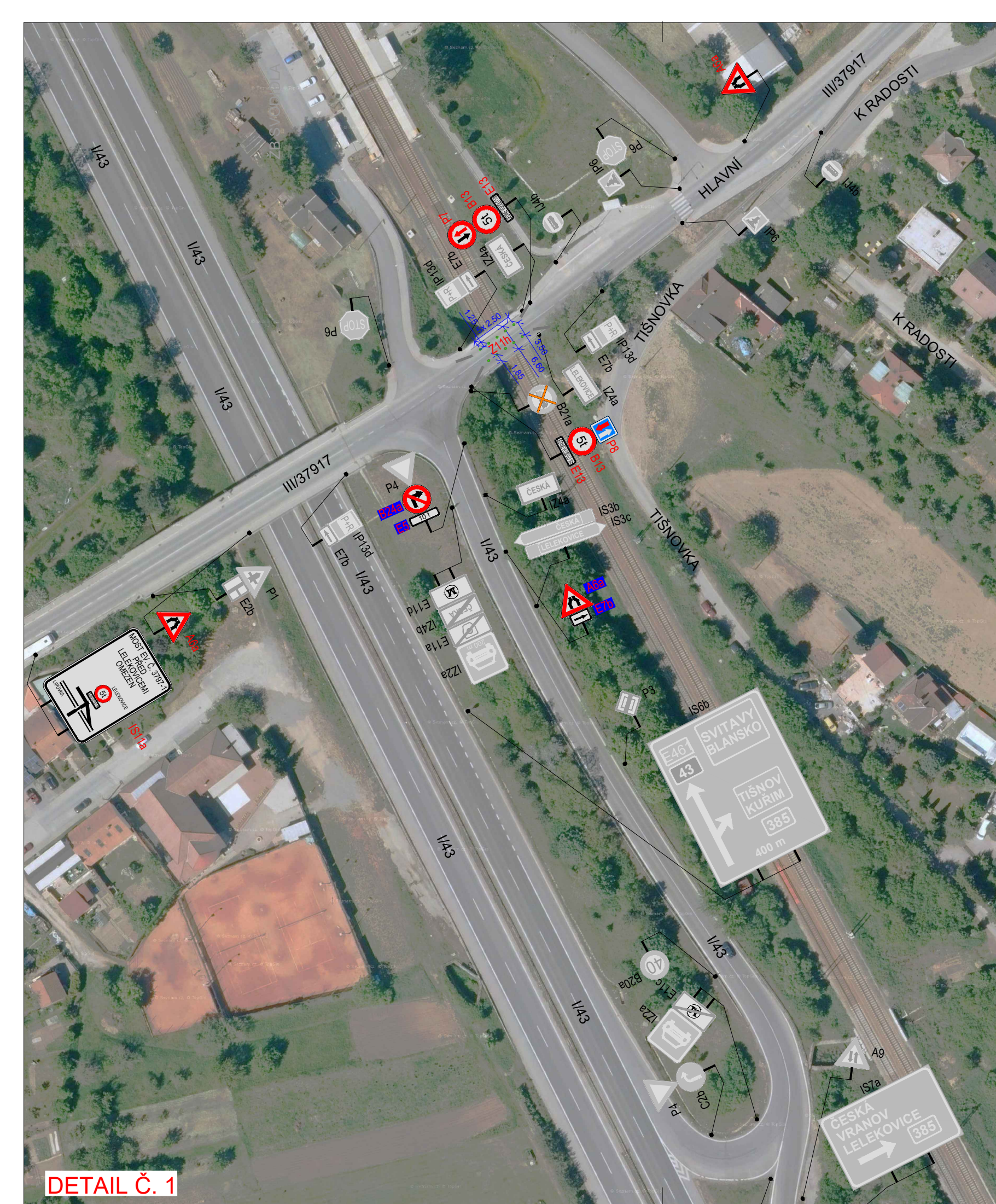
DETAIL Č. 1