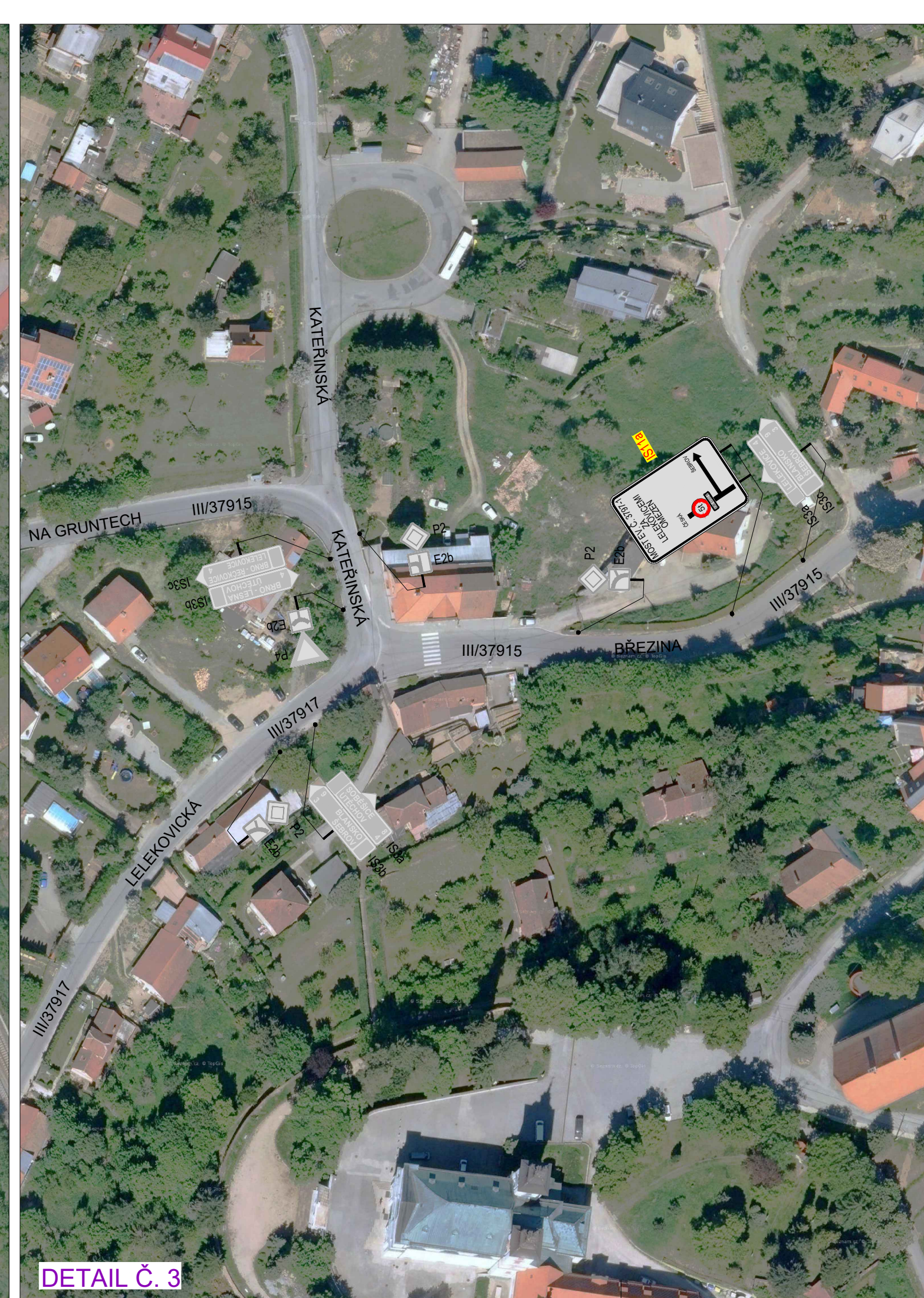
DETAIL Č. 3