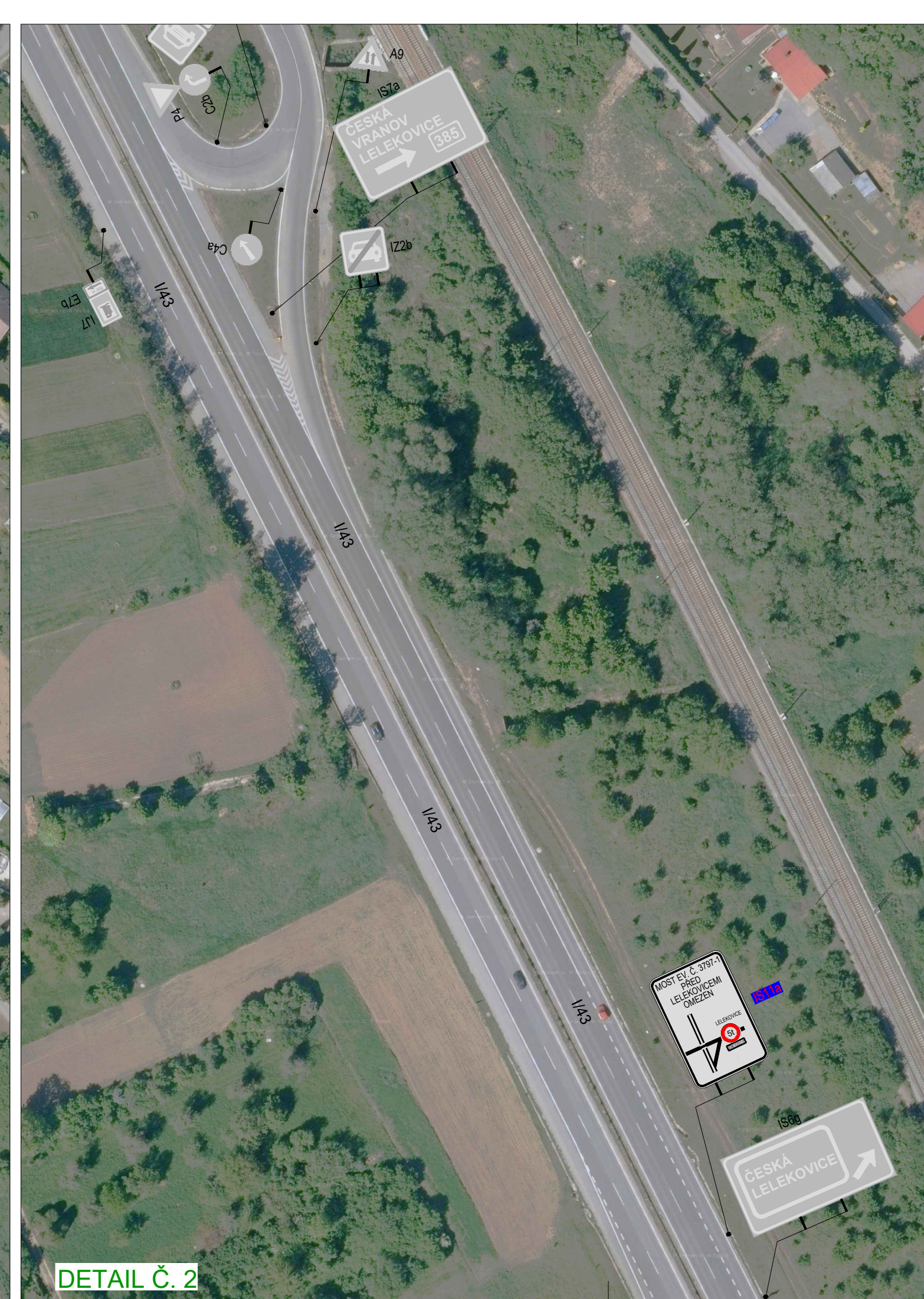
DETAIL Č. 2